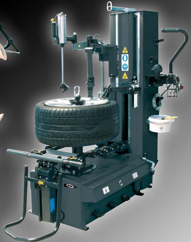
AIKIDO.34 LIGHT BMW

SPECIFIC MODELS RECOMMENDED BY BMW SERVICE