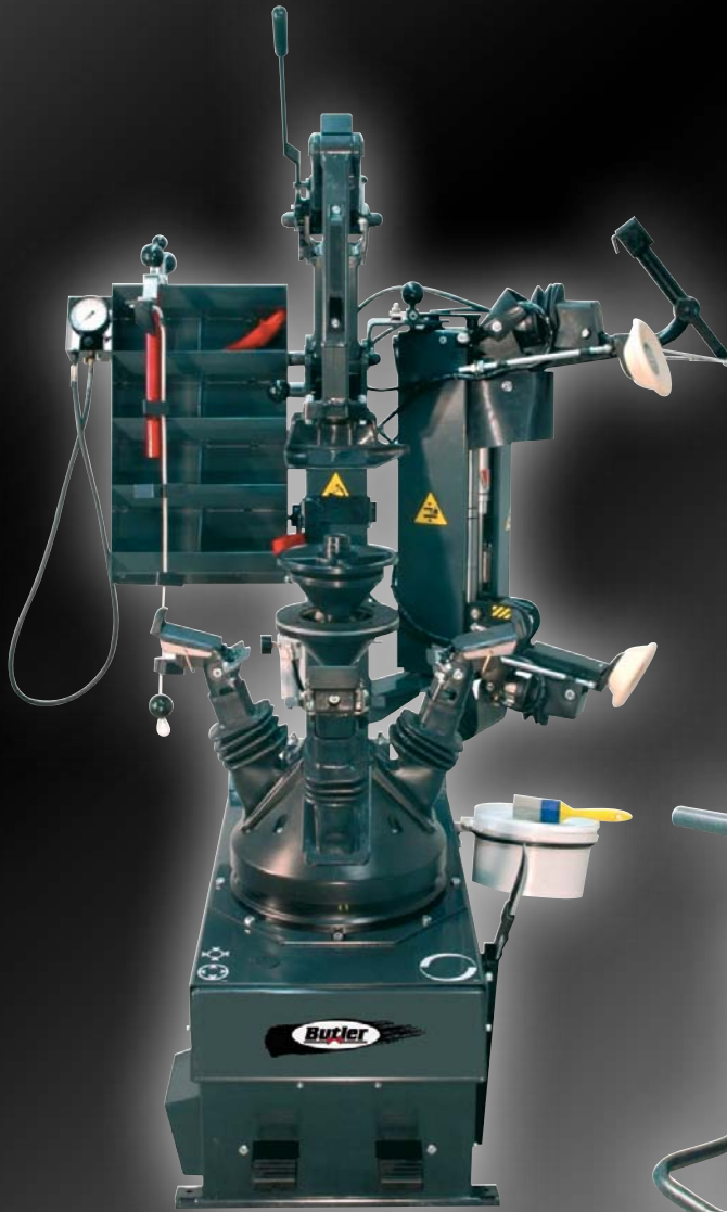
AIRDRAULIC.24 AX BMW